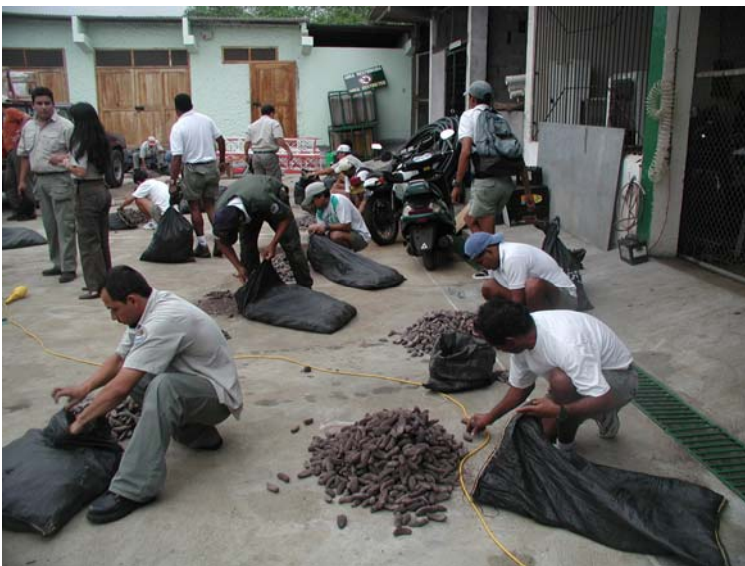
Mitarbeiter des Galápagos Nationalparks mit säckeweise beschlagnahmten, illegal gefangenen Seegurken, den so genannten „pepinos“.

Streitigkeiten in Bezug auf Fischereibeschränkungen zu Aufruhr gekommen. Anlass für die aktuellen Unruhen ist der Beginn der befristeten Fangsaison für Seegurken.